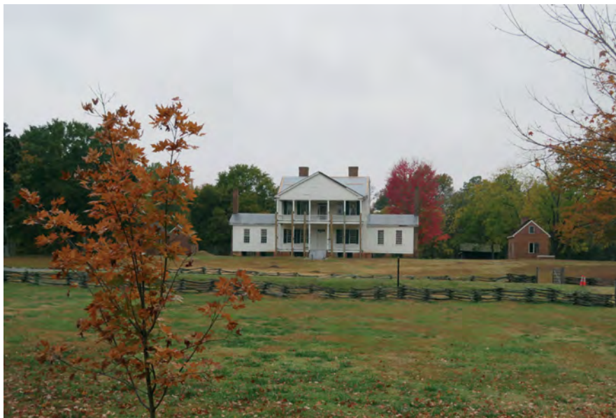
Илл. 17. Музей-усадьба «Исторический Брэттонсвилл» в графстве Йорк, штат Южная Каролина. Фото Д.М. Бондаренко.