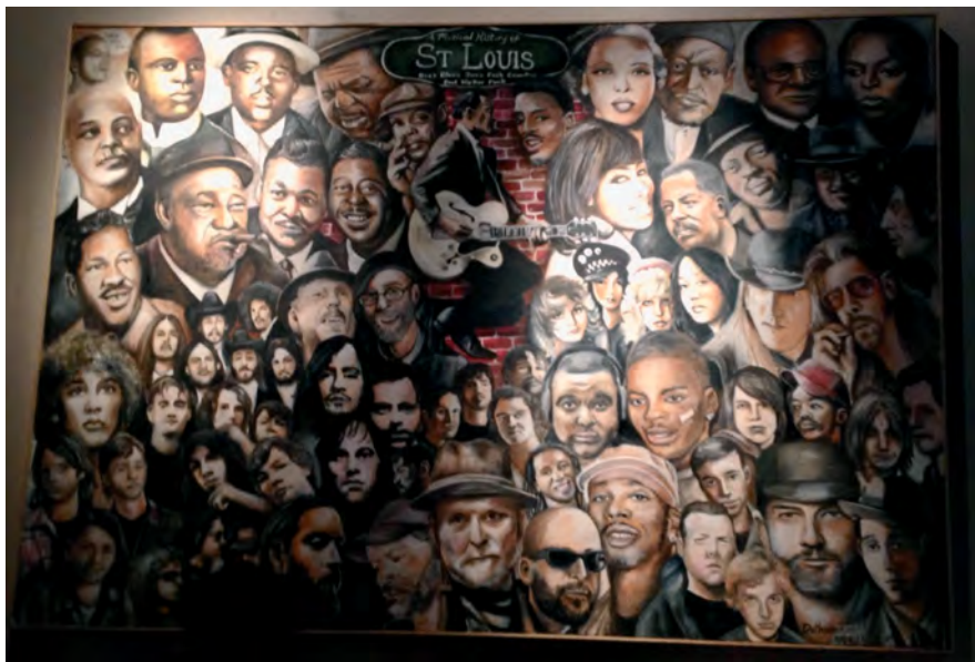
Илл. 26. Мурал с портретами выдающихся музыкантов в кафе в Сент-Луисе, штат Миссури.