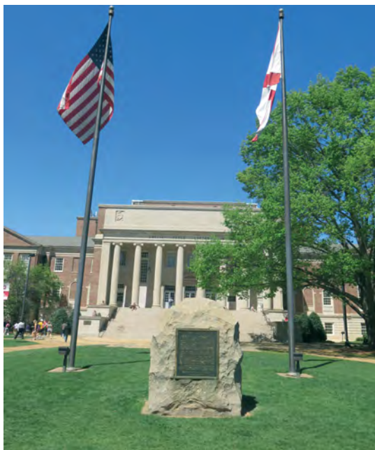
Илл. 11. Мемориал в память о связанных с университетом людях, сражавшихся на стороне Конфедерации, в кампусе Университета Алабамы в г. Тускалуза, демонтированный в июне 2020 г.