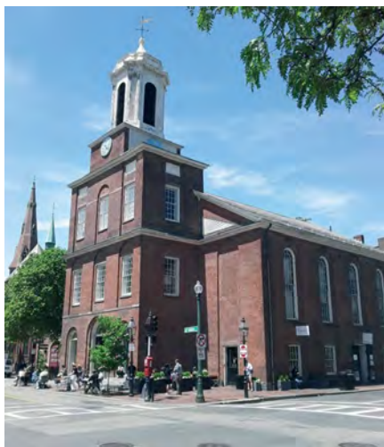
Илл. 2. Бывшая церковь на Чарлз-Стрит, являвшаяся «сердцем» черного сообщества Бикон-Хилла в Бостоне (сегодня передана в частные руки, на первом этаже расположено небольшое кафе, остальное здание занято офисами).