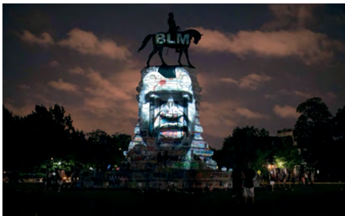
Илл. 22. Проекция изображения убитого полицейским афроамериканца Джорджа Флойда на тогда еще не снесенном памятнике генералу армии Конфедерации Роберту Ли в г. Ричмонде, штат Виргиния. https://urokiistorii.ru/articles/vojna-s-pamjatnikami (дата обращения 01.10.2023).