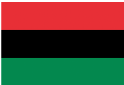
Илл. 32. «Панафриканский флаг», или «флаг Гарви». https://www.gsa.gov/about-us/regions/region-8-rocky-mountain/region-8-newsroom/rocky-mountain-region-feature-stories-and-news-releases/a-historic-flag-raising-during-black-history-month-02152023 (дата обращения 01.09.2023).