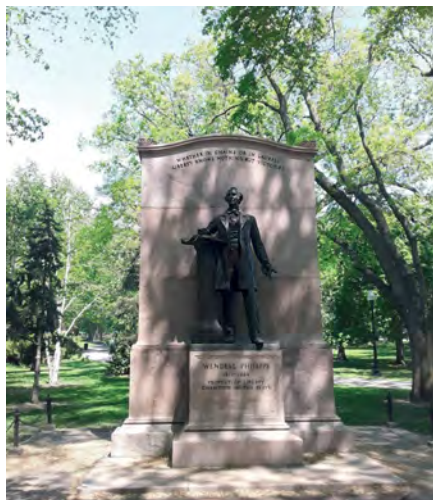
Илл. 3. Памятник abolitionисту Уэнделлу Филлипсу, «пророку свободы и защитнику рабов», – один из многих памятников белым abolitionистам в Бостоне (памятников черным деятелям этого движения намного меньше).