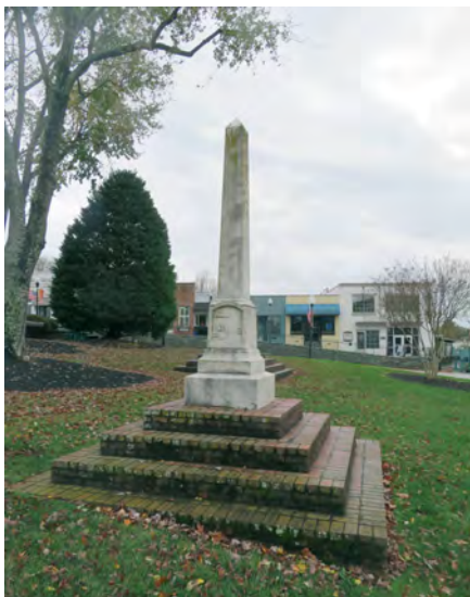
Илл. 10. Обелиск в память о «верных рабах» в Парке Конфедерации в г. Форт-Милле, штат Южная Каролина. Скульптор, возможно, Л.Д. Чайлдс, 1895 г.