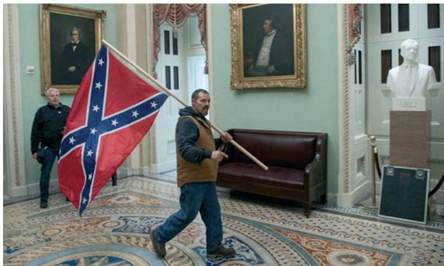
Илл. 5. Странник Д. Трампа в здании Капитолия с боевым флагом Конфедеративных Штатов Америки в руке на фоне портретов исторических деятелей середины XIX в. – защитника рабства Дж.К. Кэлхуна и аболициониста Ч. Самнера. 6 января 2021 г. https://businessinsider.com/photo-trump-supporter-riot-confederate-flag-us-capitol-2021-1 (дата обращения 12.12.2021).