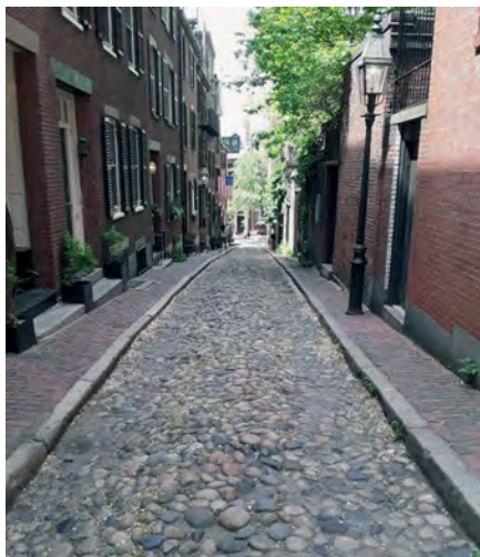
Илл. 1. Бикон-Хилл сегодня – один из самых богатых и, пожалуй, самый тихий район исторического центра Бостона, на нескольких улочках которого сохранена неизменно привлекающая внимание туристов булыжная мостовая.