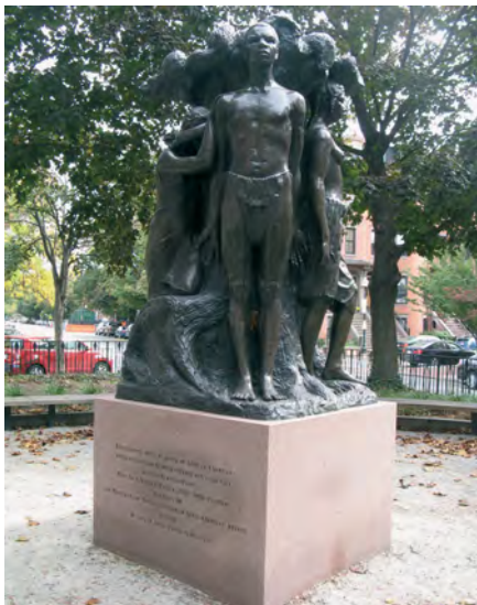
Илл. 8. Памятник «Освобождение рабов» в парке им. Гарриет Табман в Бостоне. Скульптор М.В.У. Фуллер, 1913 г.; отлит в бронзе в 1999 г.