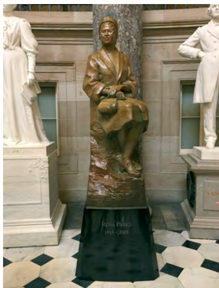
Илл. 23. Памятник Розе Паркс в Капитолии, г. Вашингтон. Открыт в феврале 2013 г.; скульптор Ю. Дауб. Роза Паркс – афроамериканка, 1 декабря 1955 г. отказавшаяся уступить место в автобусе белым пассажирам в г. Монтгомери, штат Алабама. Ее поступок вызвал бурную реакцию общественности и привел к бойкоту автобусных линий города. Это событие стало символом начала Движения за гражданские права.