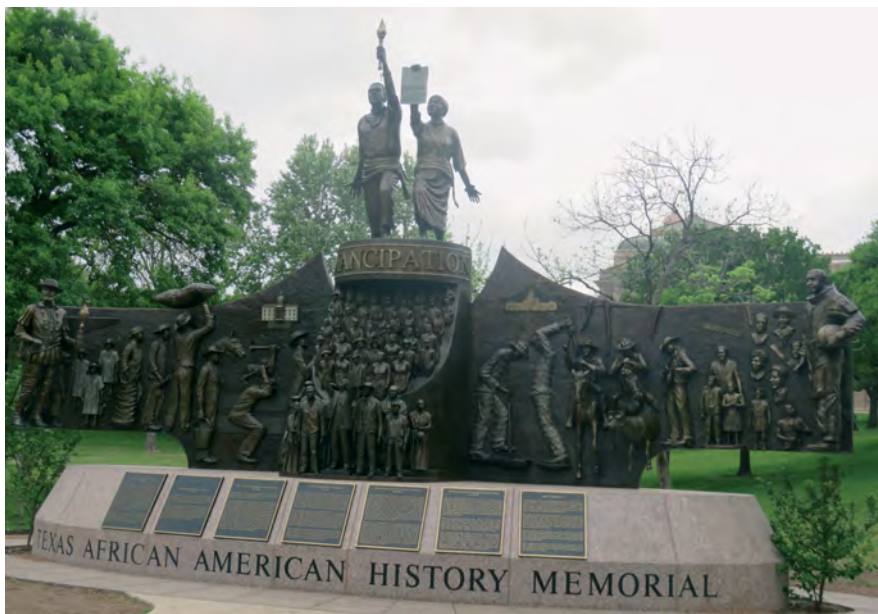
Илл. 12. «Мемориал африкано-американской истории Техаса». Скульптор Э. Дуайт, 2016 г.