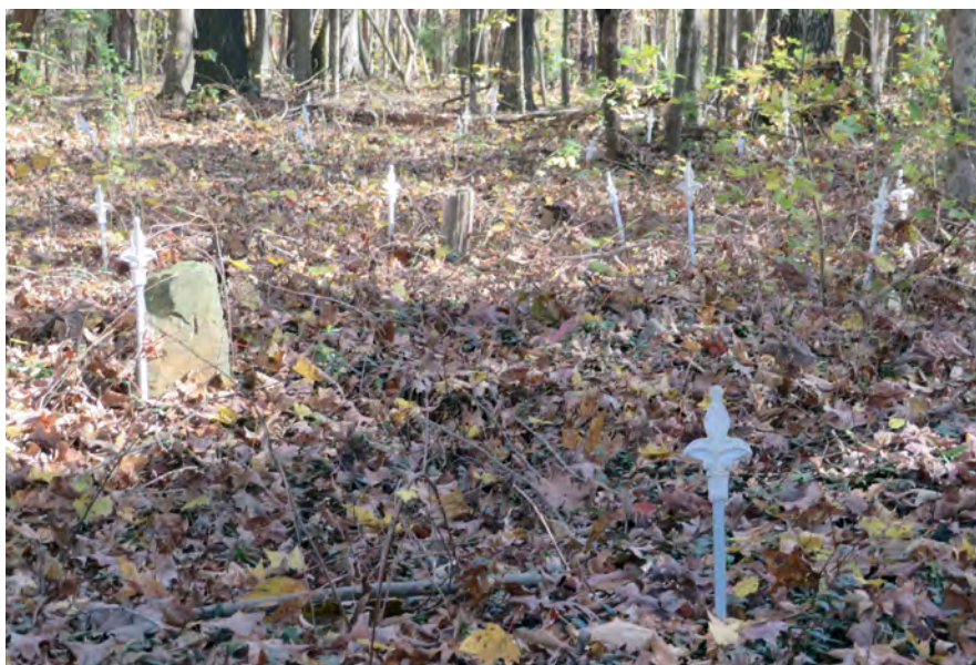
Илл. 16. Африкано-американское кладбище при пресвитерианской церкви Эллисон-Крик в графстве Йорк, штат Южная Каролина.