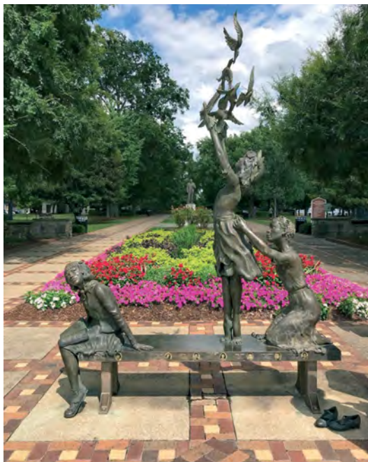
Илл. 29. Монумент в память о девочках, погибших при взрыве бомбы в баптистской церкви 15 сентября 1963 г., в сквере Келли Инграм Парк в г. Бирмингеме, штат Алабама. https://heatheronhertravels.com/wp-content/uploads/2019/10/2-Kelly-Ingram-park-Birmingham-Alabama-Photo-Heatheronhertravels.com_.jpg (дата обращения 01.10.2023).