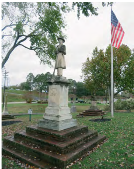
Илл. 9. Памятник «защитникам суверенитета штата» в Парке Конфедерации в г. Форт-Милле, штат Южная Каролина. Скульптор, возможно, Л.Д. Чайлдс, 1891 г.