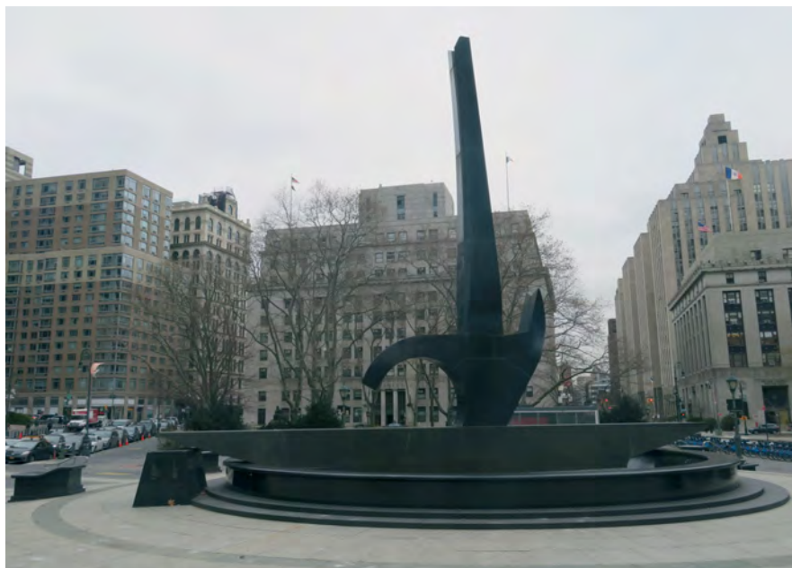
Илл. 14. «Триумф человеческого духа». Скульптор Л. Пэйс, 2000 г.