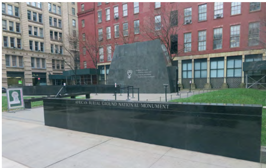
Илл. 13. Национальный памятник «Африканское захоронение». Архитекторы Р. Леон, Н. Холлант-Денис, 2007 г.