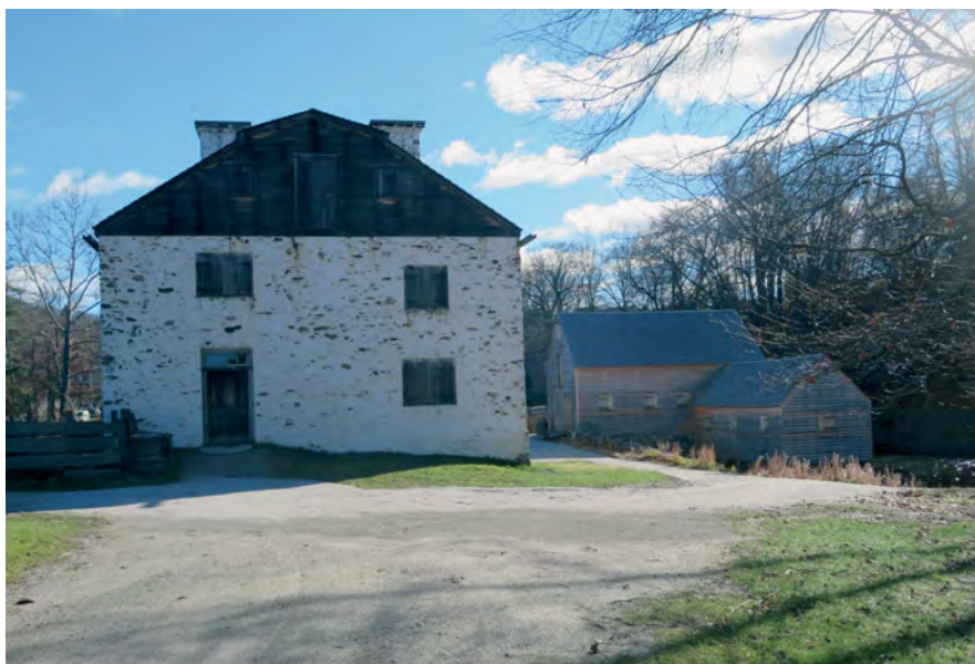
Илл. 18. Музей-усадьба Филипсбург в г. Слипи-Холлоу, графство Вестчестер, штат Нью-Йорк.