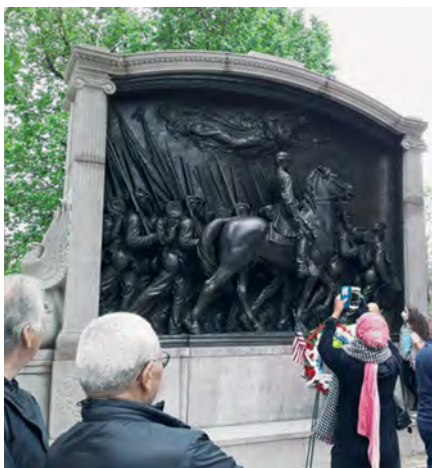
Илл. 4. Памятник 54-му Массачусетскому пехотному полку после реставрации, 2021 г.