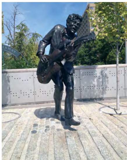
Илл. 25. Памятник знаменитому рок-музыканту Чаку Берри в его родном городе Сент-Луисе (штат Миссури), установленный еще при его жизни.