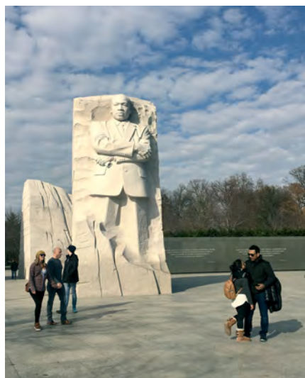
Илл. 24. «Камень Надежды» – национальный мемориал Мартина Лютера Кинга-младшего в г. Вашингтоне, округ Колумбия. Открыт в августе 2011 г.; скульптор Лэй Исинь.