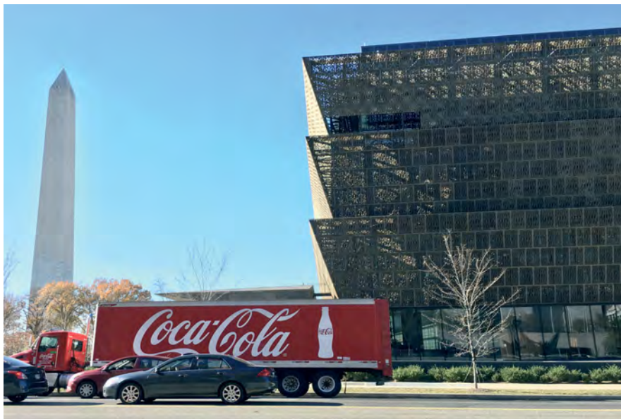
Илл. 28. Смитсоновский национальный музей африкано-американских истории и культуры в г. Вашингтоне, округ Колумбия (слева – Монумент Дж. Вашингтону).