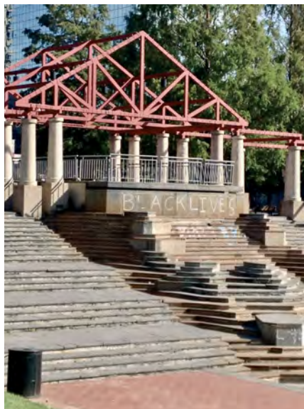
Илл. 27. Надпись в парке Киенер Плаза в центре Сент-Луиса, штат Миссури. 2015 г.