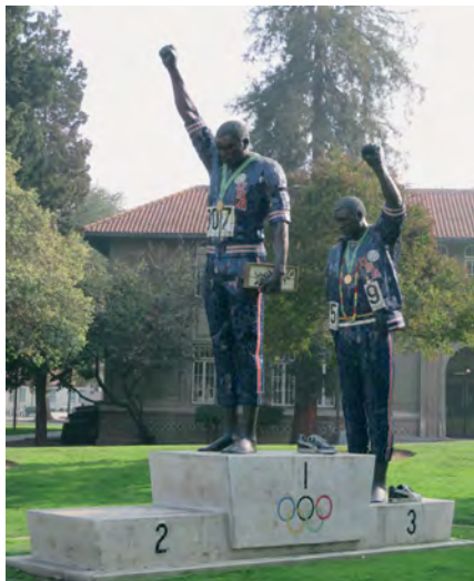
Илл. 31. Памятник Т. Смит и Дж. Карлосу в кампусе их альма-матер – Государственного университета Сан-Хосе. Автор – Р. Гувейя (Риго 23), 2005 г.

Илл. 30. Советский журнал «Огонек» в № 52 за 1968 г. писал: «На пьедестале почета победители Олимпиады в Мехико в беге на 200 м – американские негры Томми Смит (в центре) и Джон Карлос. Когда в их честь поднялся флаг США, спортсмены склонили головы и подняли вверх руку в черной перчатке. Их мужественный жест протеста против расизма в Соединенных Штатах встретил поддержку всего мира. Но руководители американских олимпийцев изгнали Смита и Карлоса из команды. У чиновников-расистов было провозглашенное Декларацией “право на свободу убеждений и на свободное выражение их”. А у победителей Олимпиады его не было». https://dzen.ru/a/X392TtOfzljumAll (дата обращения 01.10.2023).