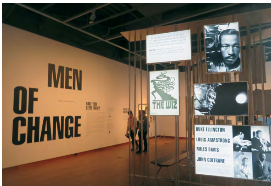
Илл. 6. Выставка «Люди перемен. Власть. Триумф. Правда», посвященная «черному наследию», в г. Шарлотт, штат Северная Каролина, ноябрь 2022 г.