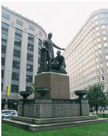
Илл. 7. Памятник «Освобождение рабов». Скульптор Т. Болл, 1879 г. Монумент стоял в центре Бостона до декабря 2020 г.